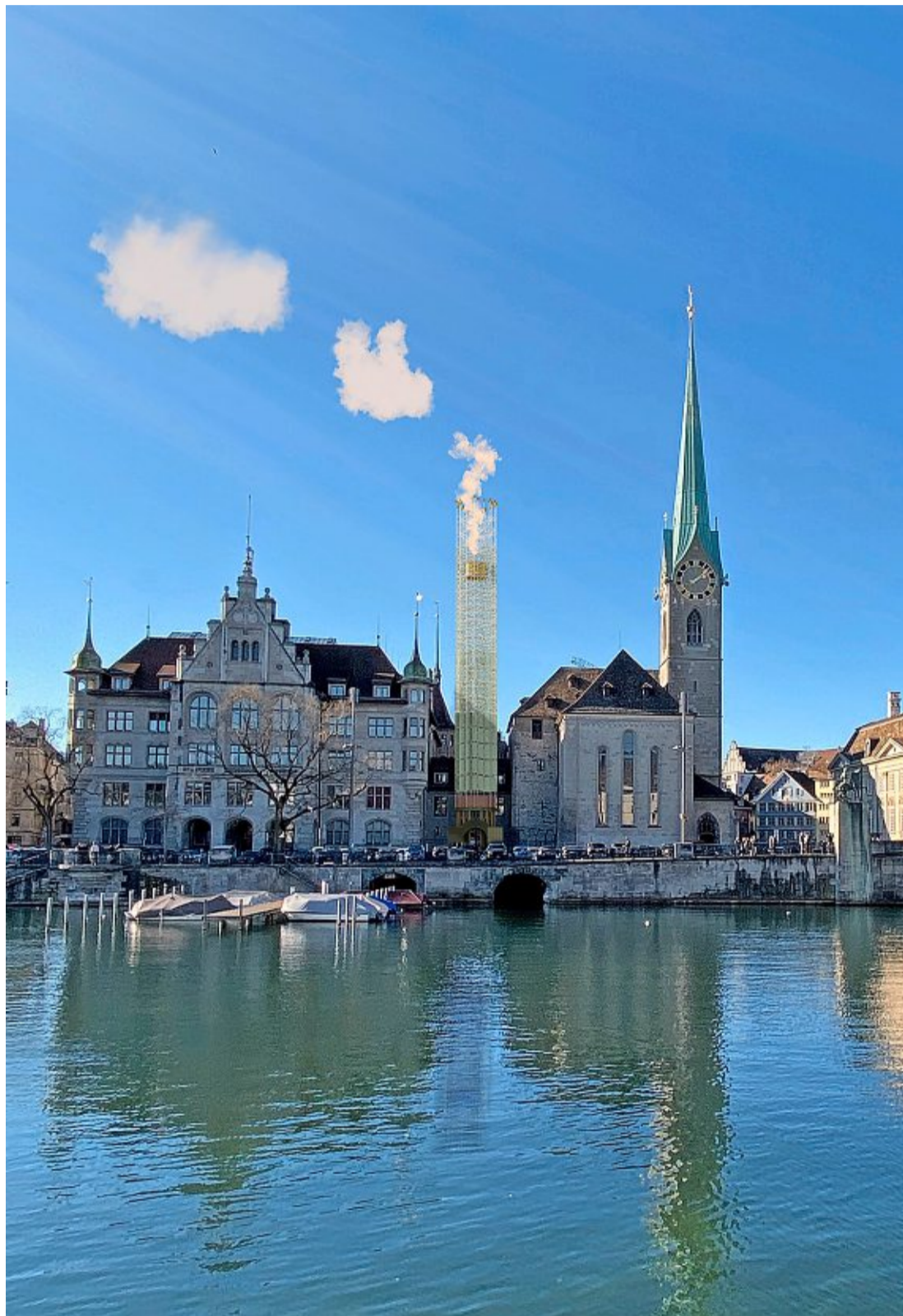
In etwa so darf man sich den geplanten Katharinen-Turm vorstellen.